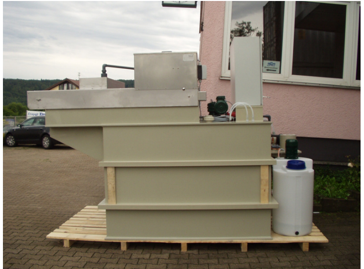
CENA compact 1500